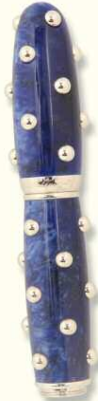
CAC 41 R