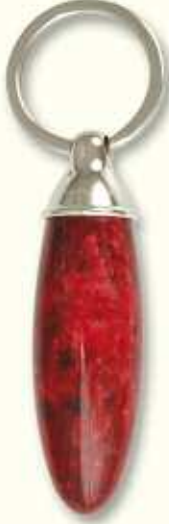
PC 47 LIS