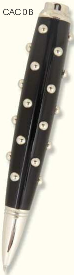
CAC 0 B