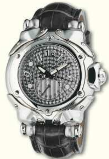
Belharra power large date metal dial with grey or brown alligator strap.