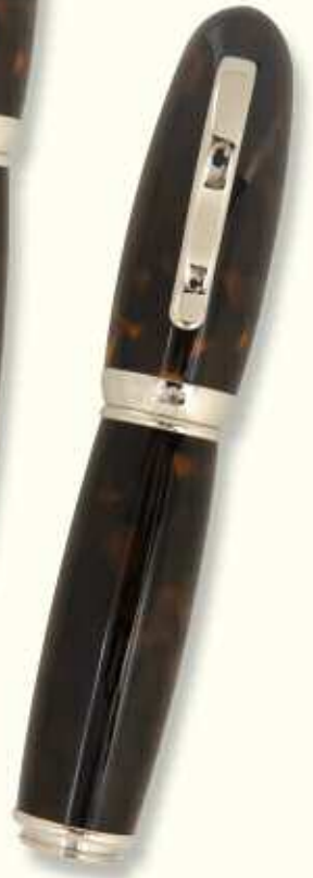
AT 43 R