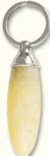
PC 34 LIS