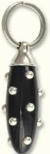
PC 0 CAC