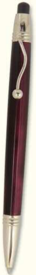
IN 57 B