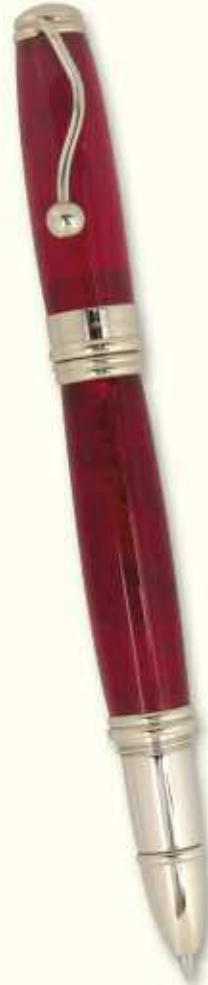
IN 47 R