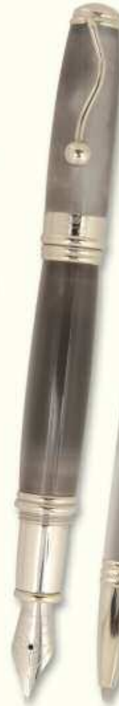
IN 60 F