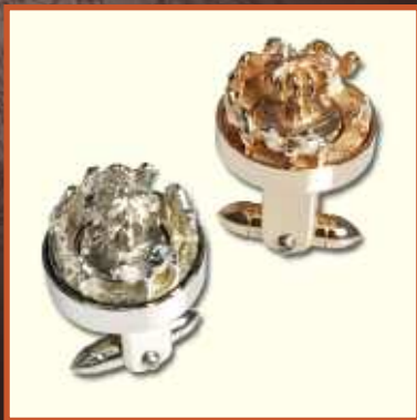
Camels and the palm