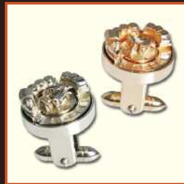
Cows and the train

Photos non contractuelles • (prototypes)