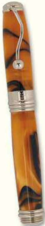
IN 33 F