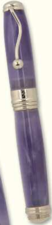
IN 59 R