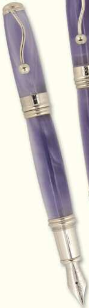
IN 59 F