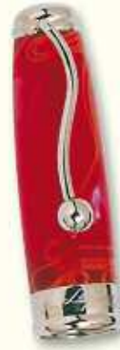
IN 31 F