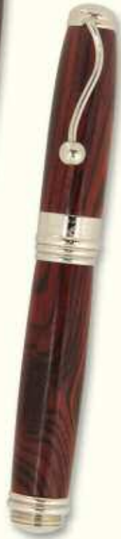
IN 72 R