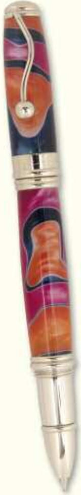
IN 22 R