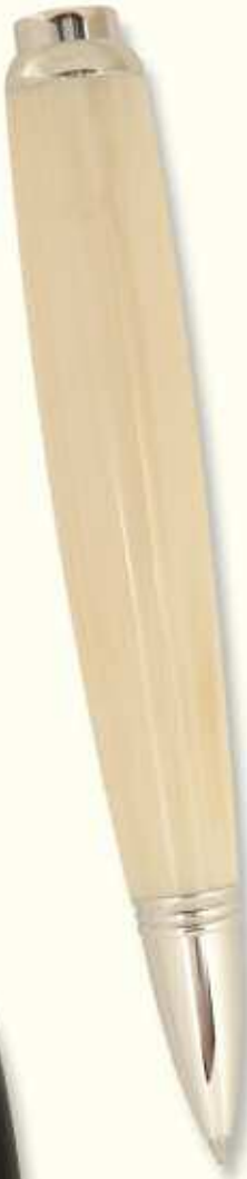
AT 34 B