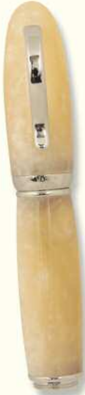
AT 34 R