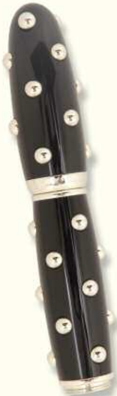
CAC 0 R