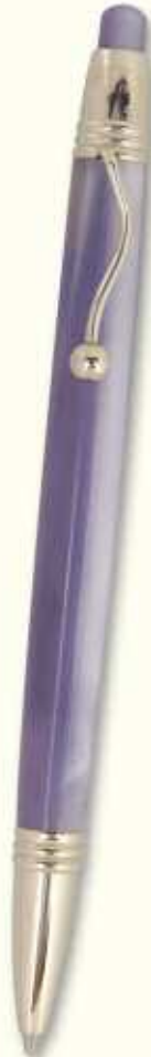
IN 59 B