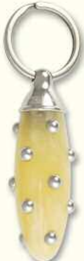
PC 34 CAC