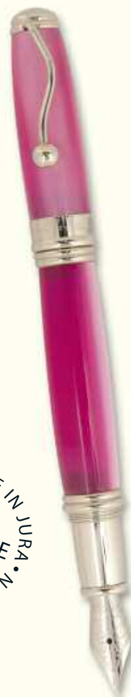
IN 58 F