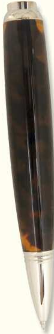
AT 43 B