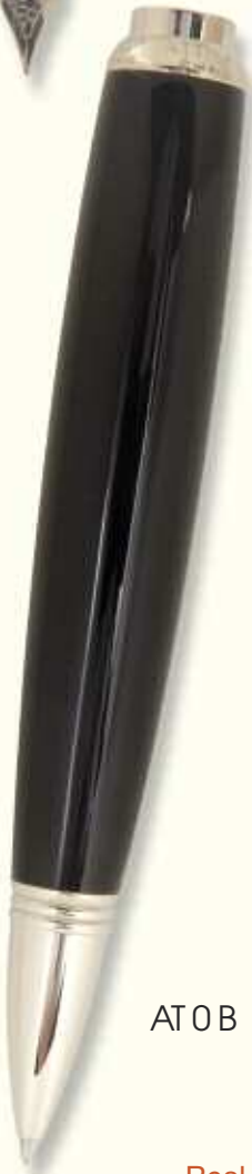
AT 0 B