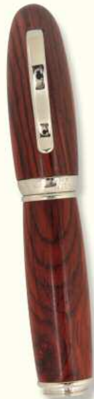
AT 72 R