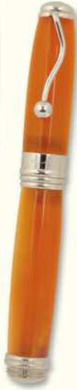
IN 37 F