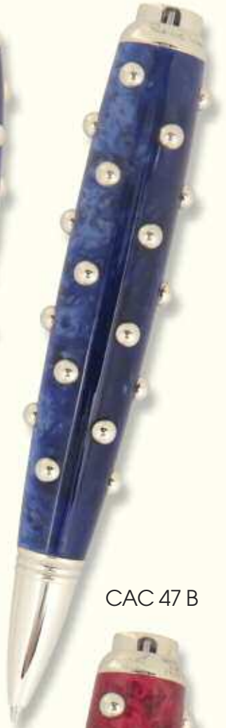
CAC 47 B