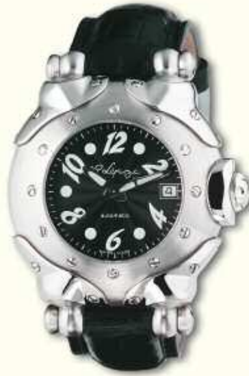
Belharra black HMS with black alligator strap.