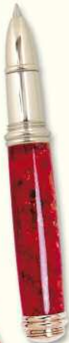
IN 46 R