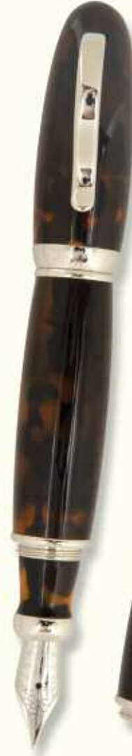
AT 43 F