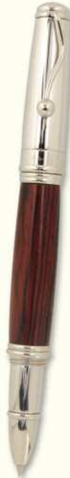
IN 74 R