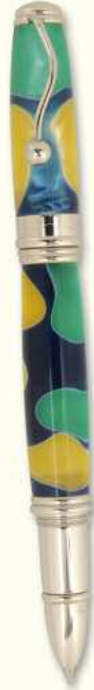
IN 21 R