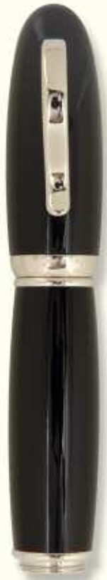
AT 0 F