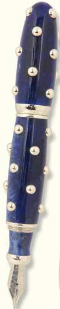
CAC 41 F