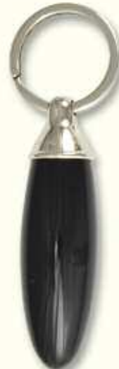
PC 0 LIS