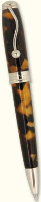
IN 43 BT