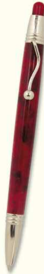
IN 47 B