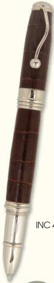
INC 43 R