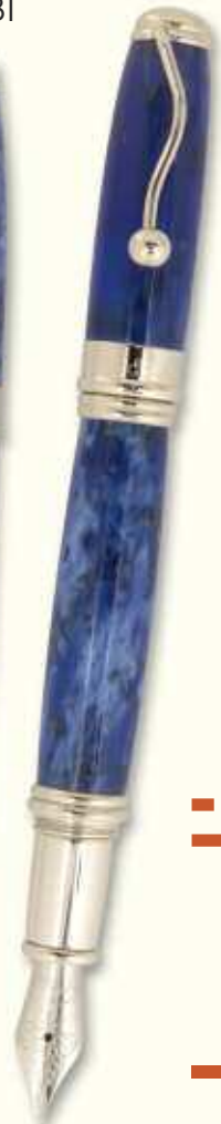
IN 41 F