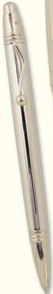
IN 50 B