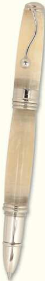
IN 34 R