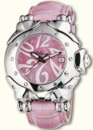
Belharra pink nacre dial with diamond HMS with pink alligator strap.