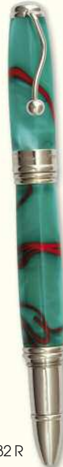
IN 32 R