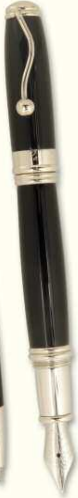
IN 0 F