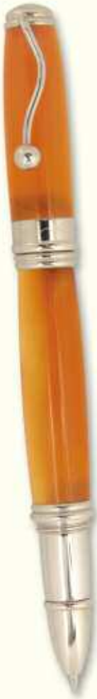
IN 37 R