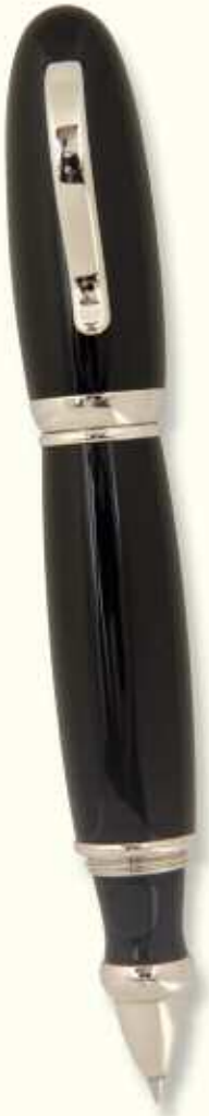
AT 0 R