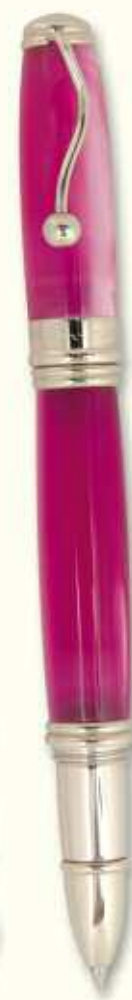
IN 58 R