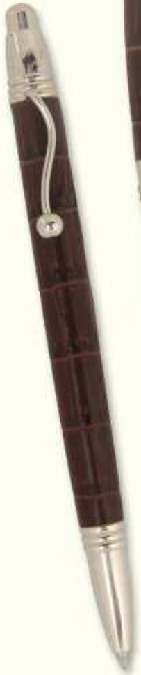
INC 43 B