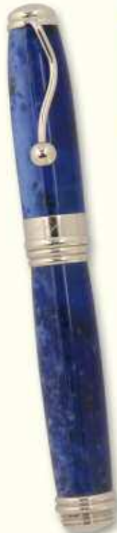
IN 41 R