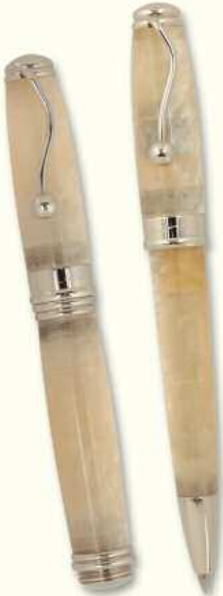
IN 34 BT