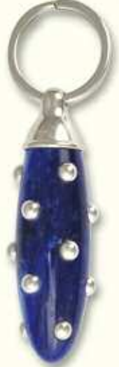
PC 41 CAC