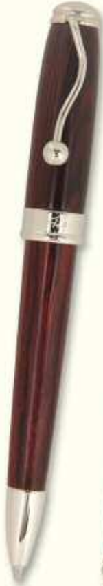
IN 72 BT