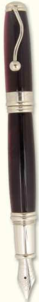
IN 57 F