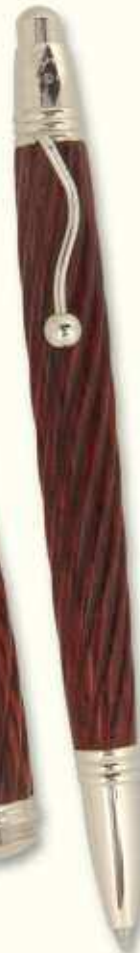
IN 75 B