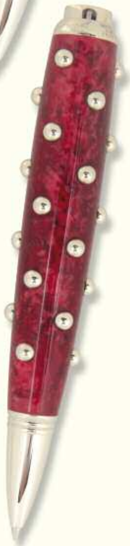
CAC 47 B