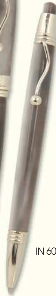
IN 60 B