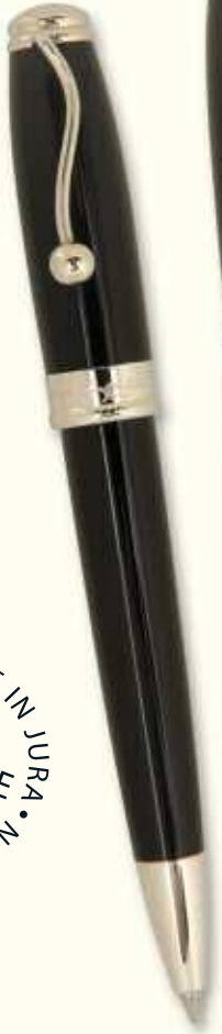
IN 0 BT