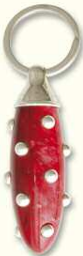
PC 47 CAC