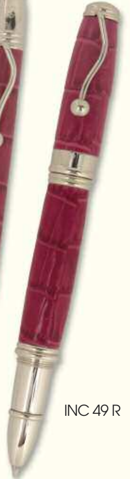
INC 49 R