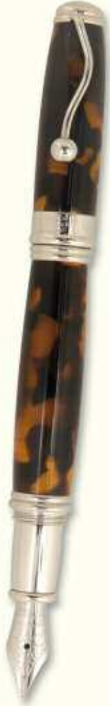
IN 43 F