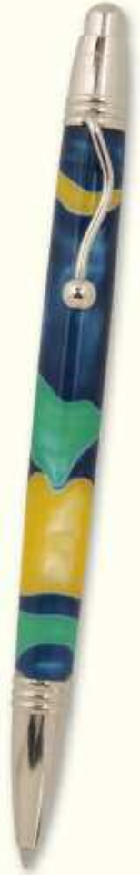
IN 21 B