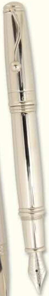
IN 50 F