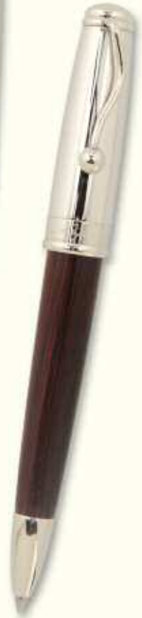
IN 74 BT