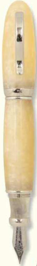
AT 34 F