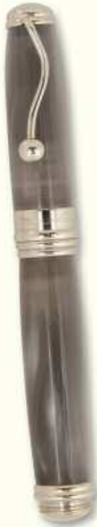
IN 60 R