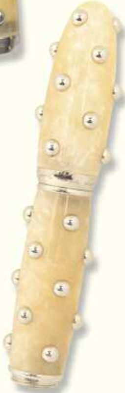
CAC 34 R