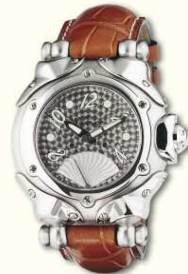
Belharra second retro metal dial with grey or brown alligator strap.