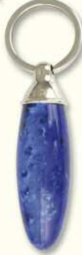
PC 41 LIS