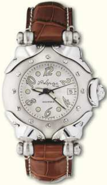
Belharra champagne HMS with brown alligator strap.