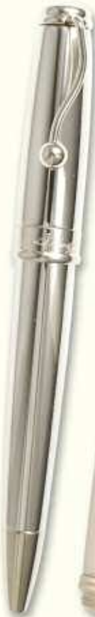
IN 50 BT