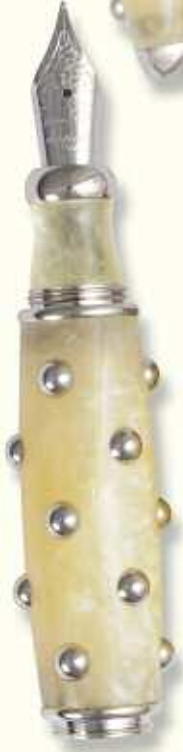
CAC 34 F