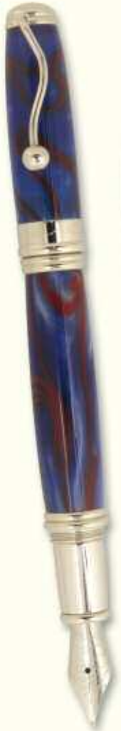
IN 36 F