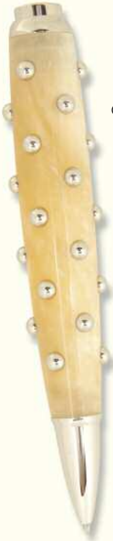
CAC 34 B